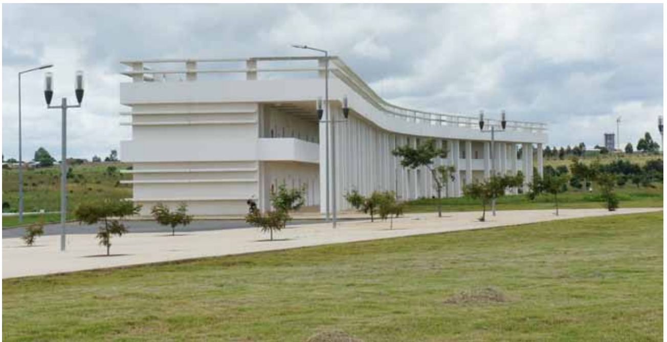
Fig.2: Vista parcial do Edifício das Salas de Aula nas instalações de Cambiote, Huambo.