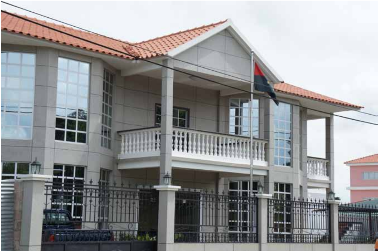
Fig. 3: Em Dezembro de 2012 a Reitoria da UJES mudou-se para estas instalações, igualmente arrendadas.