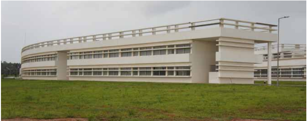
Fig.1: Futuras instalações da UJES em Cambiote, no embrião da Cidade Universitária. Huambo.