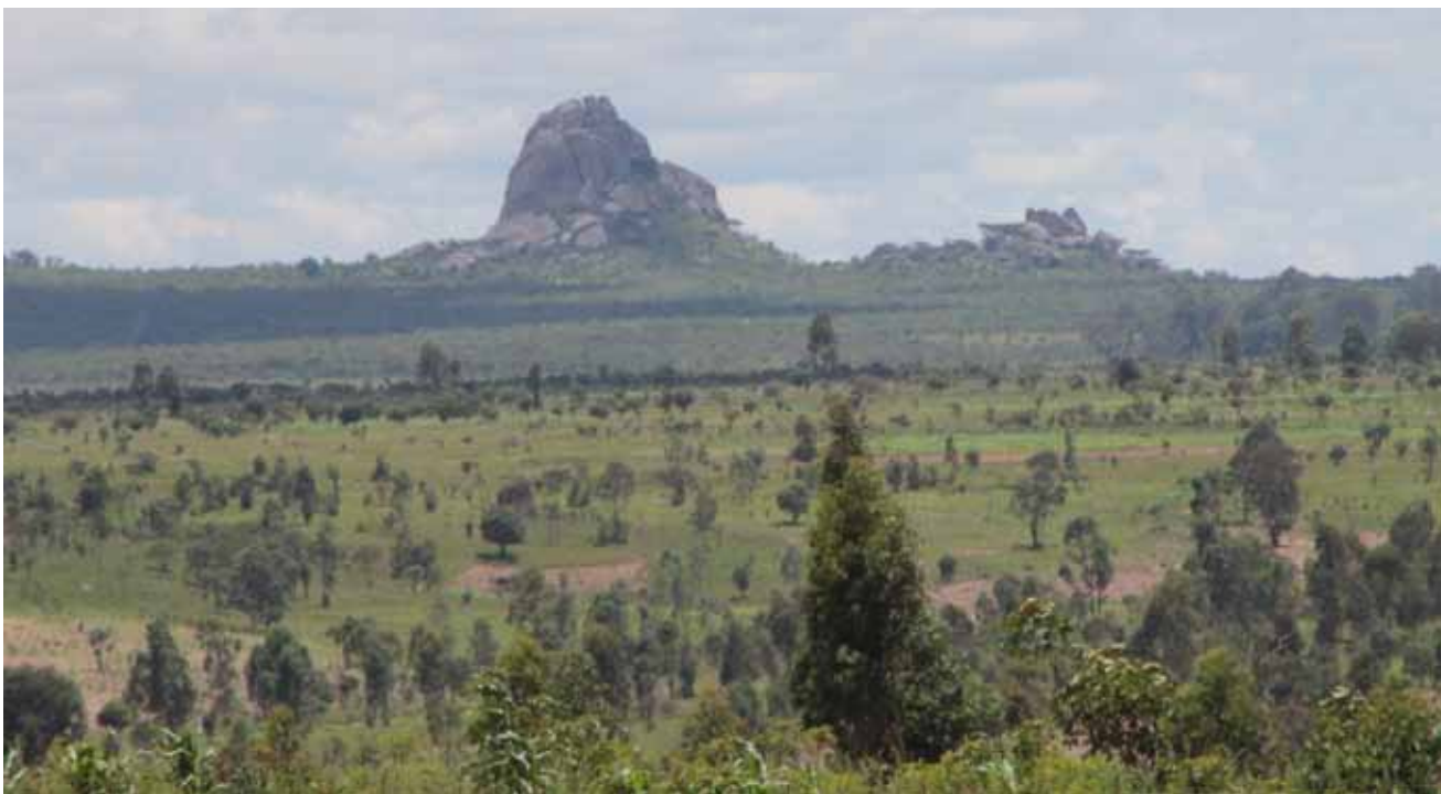
Fig. 4: No Huambo, no Município de Cambiote, foi reservada uma área de 2.500 hectares para a futura cidade universitária JES.